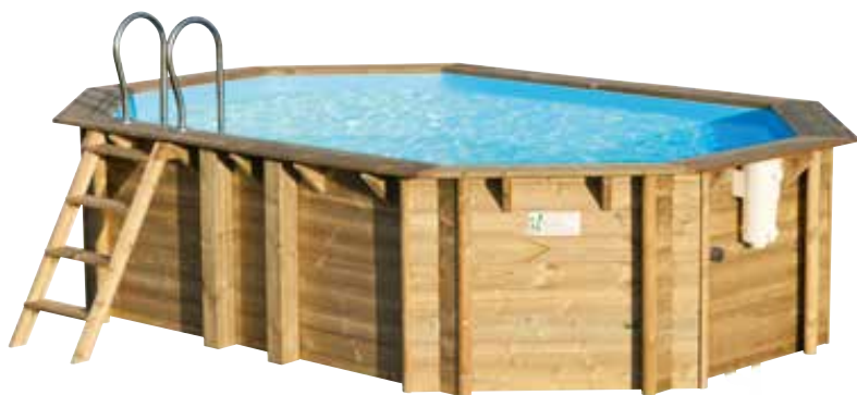
Photo non contractuelle (la gamme Tropic est livrée sans profils de recouvrement arrondis)