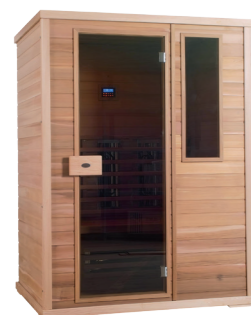
Infralive Confort 150 L : 150 P : 120 H : 200 cm Rayonnements : 6 Puissance : 2200 W Capacité : 2 à 3 personnes