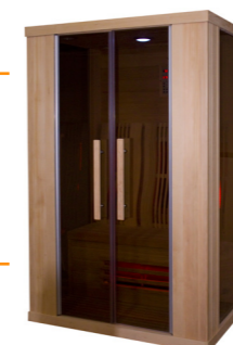
Infralive High 130 L : 130 P : 100 H : 200 cm Rayonnements : 6 Puissance : 2200 W Capacité : 2 personnes