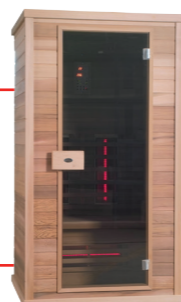
Infralive Confort 110 L : 110 P : 100 H : 200 cm Rayonnements : 5 Puissance : 1900 W Capacité : 1 à 2 personnes