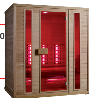
Infralive Confort 180 L : 180 P : 120 H : 200 cm Rayonnements : 8 Puissance : 2800 W Capacité : 4 personnes