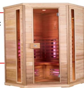
Infralive Confort 150C L : 150 P : 150 H : 200 cm Rayonnements : 8 Puissance : 2800 W Capacité : 4 personnes