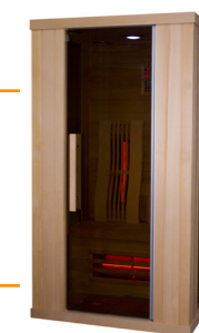
Infralive High 110 L : 110 P : 100 H : 200 cm Rayonnements : 5 Puissance : 1900 W Capacité : 1 à 2 personnes