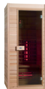
Infralive Confort 90 L : 90 P : 90 H : 200 cm Rayonnements : 4 Puissance : 1400 W Capacité : 1 personne