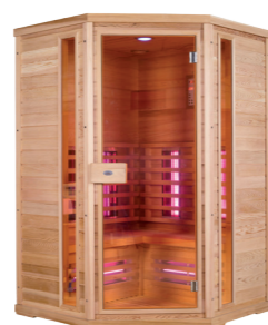
Infralive Confort 130C L : 130 P : 130 H : 200 cm Rayonnements : 6 Puissance : 1800 W Capacité : 2 à 3 personnes