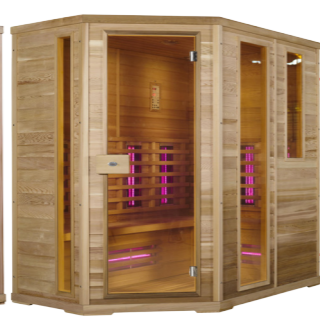
Infralive Confort 210L L : 210 P : 140 H : 200 cm Rayonnements : 10 Puissance : 3400 W Capacité : 5 personnes