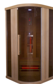
Infralive High 100C L : 100 P : 100 H : 200 cm Rayonnements : 4 Puissance : 1600 W Capacité : 1 personne