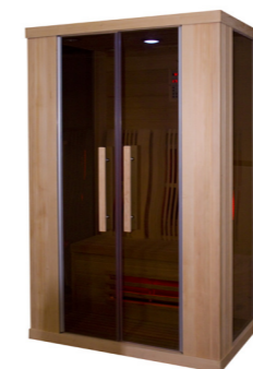
Infralive High 150 L : 150 P : 100 H : 200 cm Rayonnements : 6 Puissance : 2200 W Capacité : 2 à 3 personnes