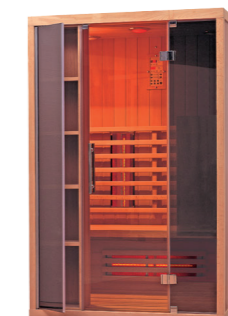
Infralive High 130+ L : 130 P : 100 H : 200 cm Rayonnements : 6 Puissance : 2200 W Capacité : 2 personnes